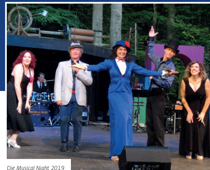
Die Musical Night 2019

Text: Jürgen Spiels