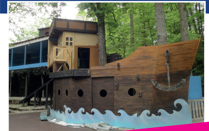
Das imposante „Peter Pan“ Bühnenbild